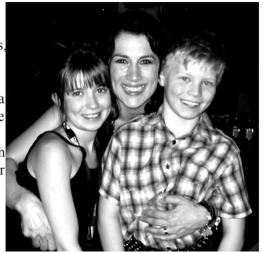
Att få träffa Jill Johnson var nog en bidragande orsak till riksdagsintresset