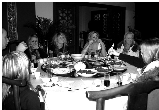
Ett gäng Latorpare äter äkta Kinamat

var nog kinamuren. Och så shoppade vi en massa... Det bästa med resan var att vi var ett så bra gäng. Tack för att ni ledare i Elim ordnade det så bra och att jag fick följa med!