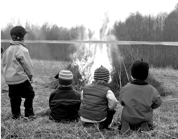
Intresserade brasbevakare, Valborg 2006